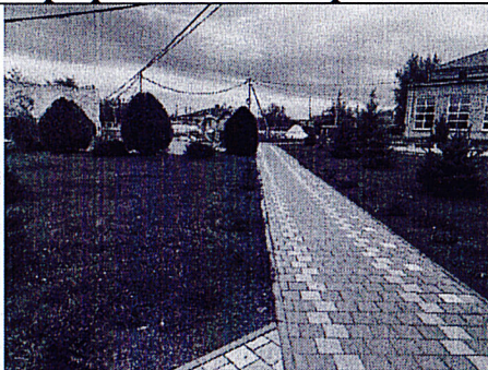
Состояние объекта «До»