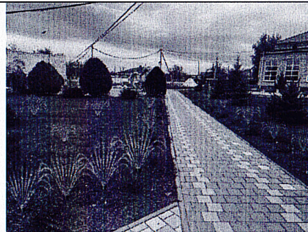
Визуализация будущего проекта